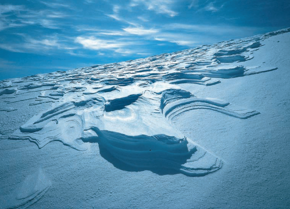
❖ ZASTRUGI – WAŁY ZMROŻONEGO ŚNIEGU WYRZEŻBIONE PRZEZ WIATR.

po dotarciu na wierzchołek wschodni ma spore zapasy energii, może rozważyć trawers Piz Palü, a przy dużej motywacji od razu jeszcze grań La Spedla (Spallagrat) prowadzącą na Piz Bernina.